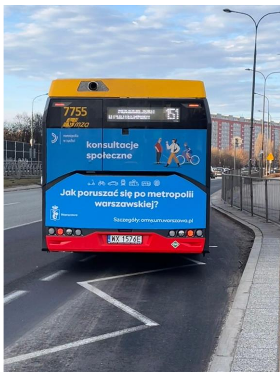
Fot. 2. Reklama konsultacji społecznych w komunikacji miejskiej (tył autobusu)